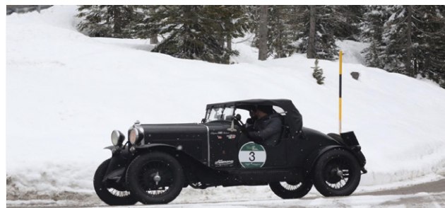
La FIAT 514 S dei vincitori Fontanella - Covelli

A tutti un cordiale arrivederci alla edizione 2025 !!