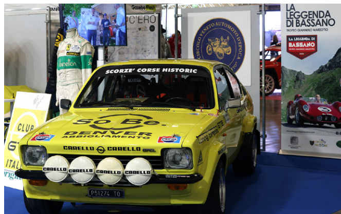
L'Opel Kadett GTE GR.2 sveltava nel nostro stand