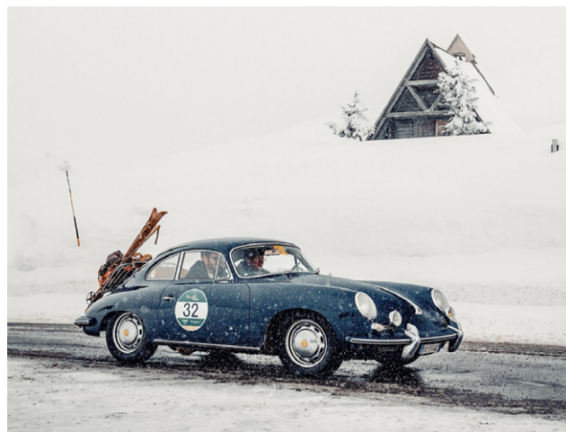
Porsche 356 in perfetto stile invernale