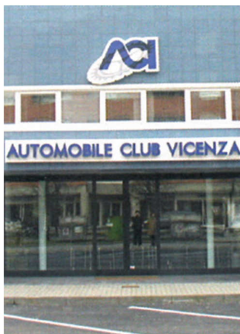
Il nostro nuovo ufficio presso la sede ACI di Vicenza

Novità importante per il nostro Club. Per venire maggiormente incontro alle necessità dei Soci residenti a Vicenza e dintorni e nell'ambito di una sempre maggiore e proficua collaborazione con tutti gli enti che tutelano il motorismo storico, da Lunedì 6 Marzo aprirà il nuovo ufficio di Vicenza situato presso la sede dell'ACI in Via Enrico Fermi n. 233. È situato al primo piano e sarà aperto il Lunedì dalle ore 09.00 alle 13.00 ed il Mercoledì dalle ore 13.30 alle 16.00. Il numero di telefono è 0424.512057 oppure 349.4009761.