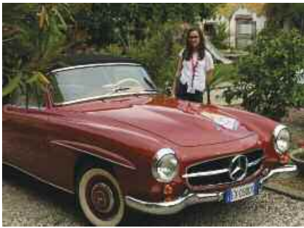
l'autrice del resoconto

Domenica 5 GIUGNO si è svolta la 6a edizione de "La 90 Miglia dei Berici".