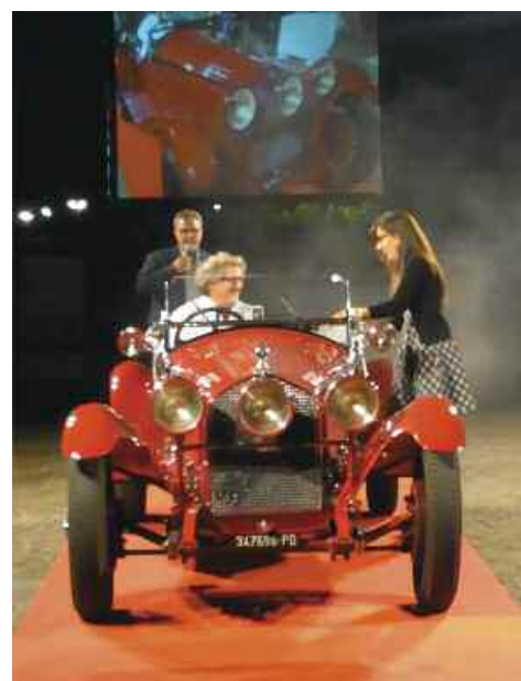
Alfa Romeo 6C 1750 GS Zagato 1931