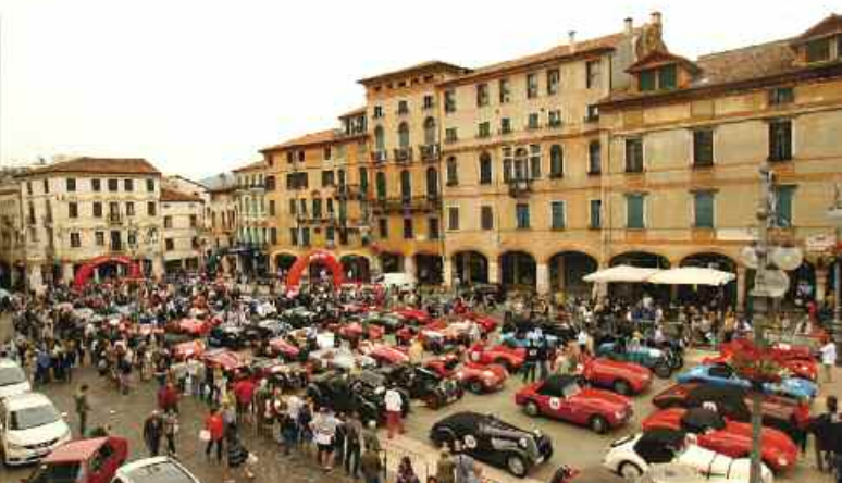
L'incredibile spettacolo offerto dalla Piazza di Bassano