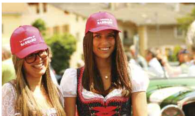
Le hostess di Sarentino