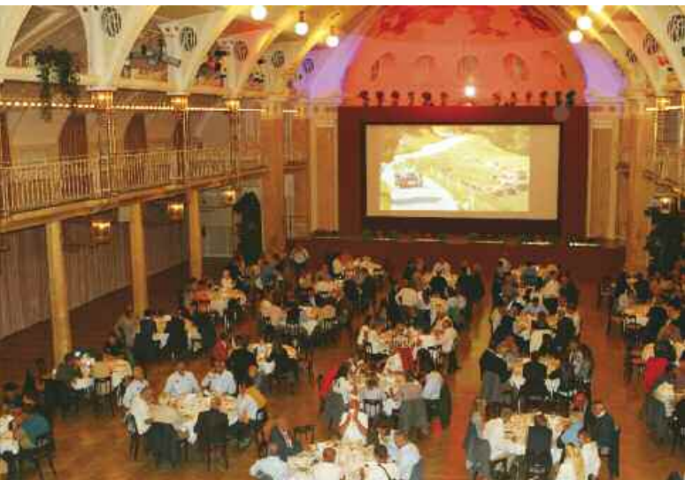
Cena di Gala al Kursaal di Merano