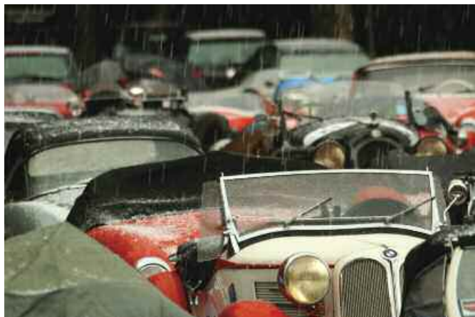
Sosta con grandine