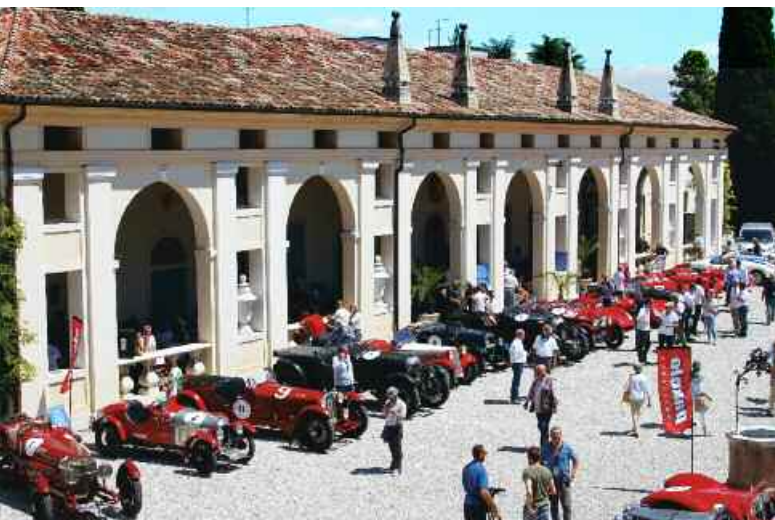
Le verifiche a Ca' Cornaro