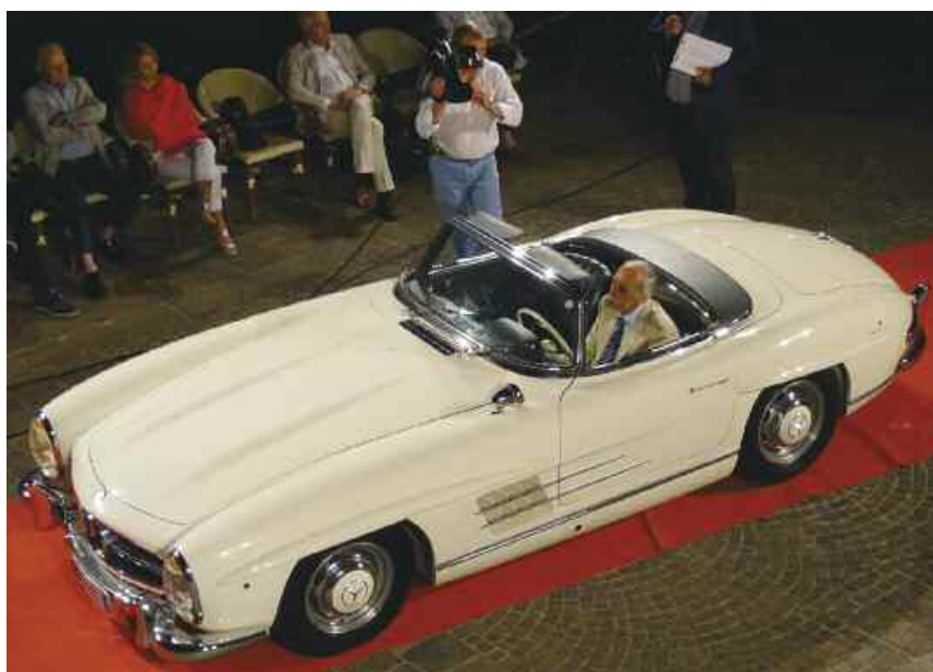
The Best of Show, Mercedes 300 SL Roadster del 1957