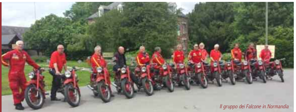
Il gruppo dei Falcone in Normandia

Il gruppo dei Guzzisti del Circolo Veneto in sella al mitico Falcone hanno percorso le strade, dalla zona di Parigi, al Nord Est della Francia toccando i centri più importanti e visitando i luoghi dove gli alleati hanno, nel Giugno del 1944, iniziato a invadere la Francia occupata dai Nazisti.