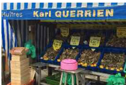
Uno spuntino quanto mai gradito

Lasciata la costa si visita a Loheac il Museo dell'automobile, complesso fornitissimo di pezzi quanto mai interessanti e rari. Alla partenza dal museo si incontra una coppia di giornalisti sportivi che fanno numerosissime foto del gruppo, dando appuntamento a Mandello sul