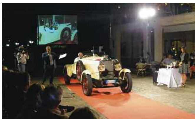
Vauxhall 20-60 Speedster Boat Tail 1929

Dopo la fortunata esperienza del 2015, il Circolo Veneto Automoto d'Epoca "G. Marzotto" insieme al Golf della Montecchia ha deciso di organizzare la 12° edizione di Auto & Arte "Memorial Giovanni Galtarossa", sempre all'interno della magica atmosfera che solo un Golf Club famoso come questo può regalare.