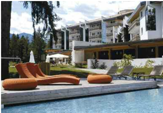
Grand Hotel Terme di Comano