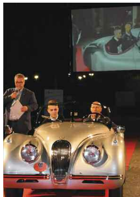
Il Presidente del Camsc con la sua Jaguar XK 120 del 1953