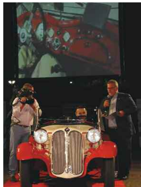
BMW 319-1 Roadster 1936

Durante la serata sono stati anche ricordati i 50 anni dell'A.S.I. (Automotoclub Storico Italiano) e l'importante lavoro svolto da questa Federazione nel divulgare la cultura del motorismo storico in generale.