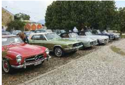
le auto allineate in Cantina

cati presso due cantine. Durante la visita della prima, la Cantina Piovene Porto Godi a Toara, ha iniziato a diluviare, ma questo non ci ha impedito di visitarla con la gioia e l'entusiasmo che in questi, come negli altri raduni, non manca mai. Finita la visita, ci siamo diretti verso la Trattoria "Le Vescovane", dove fortunatamente ha smesso di piovere e abbiamo quindi po-